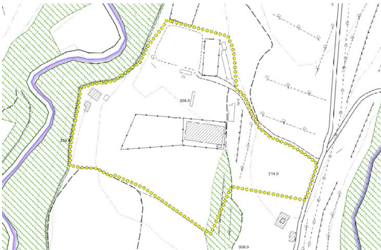
Beni paesaggistici (estratto Tavola Vincoli Sovraordinati) - Scala 1:3.000